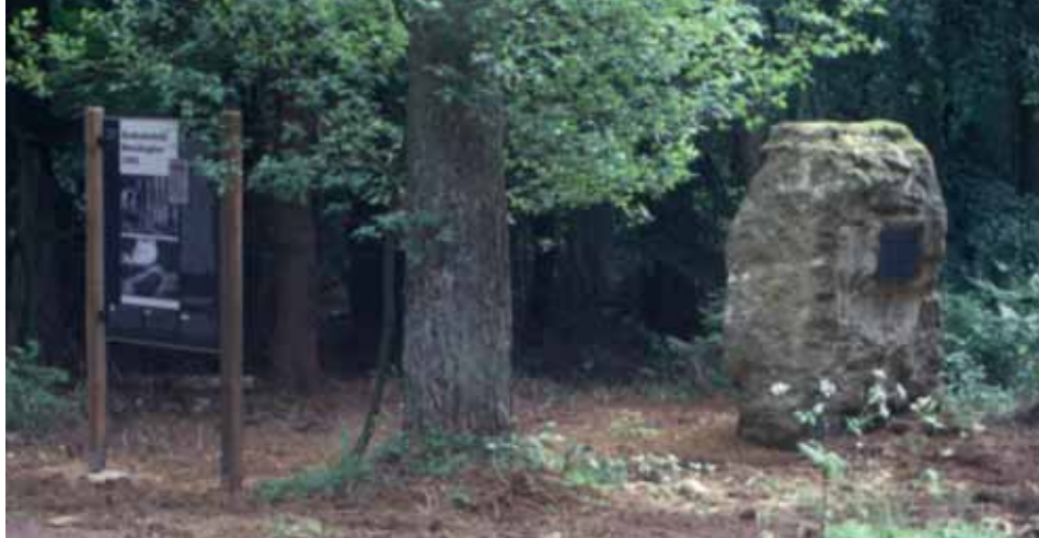
Gedenkstein für die 1942 ermordeten Teilnehmer des Luxemburger Generalstreiks

in Berlin vorgelegt, welches entschied, dass die 25 Luxemburger sofort zu erschießen seien.