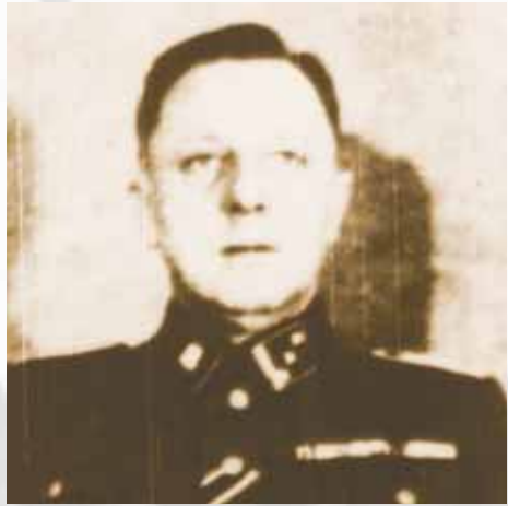
Lagerkommandant Paul Sporrenberg

de. Eine weitere „Aufwertung“ in dem KZ-System erfuhr das Lager am 7. Februar 1942 durch die Zuordnung zum Wirtschafts- und Verwaltungshauptamt der SS (WVHA). Dies fiel noch in die Zuständigkeit Zills, der im April 1942 als stellvertretender Kommandant zum KZ Natzweiler im Elsass versetzt wurde. Als dritter Kommandant des Lagers Hinzert folgte ihm Paul Sporrenberg. Formal behielt das SS-Sonderlager/KZ Hinzert seine Eigenständigkeit, bis es am 21. November 1944 dem Konzentrationslager Buchenwald zugeordnet wurde.