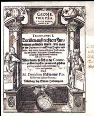
Daniel Schwenter, Geometria practica nova Entstehung: Nürnberg: Simon Halbmayer, 1518 Wiss. Bibliothek der Stadt Trier