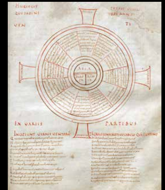
Beda Venerabilis, De natura rerum Entstehung: Reims oder Laon, 1. Hälfte 9. Jahrhundert Wiss. Bibliothek der Stadt Trier