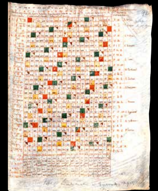
Tafeln der Lunarbuchstaben zur Berechnung des Osterfestes Entstehung: Trier, Abtei St. Matthias, 11. Jahrhundert Wiss. Bibliothek der Stadt Trier