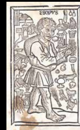
Äsop, Vita et fabulae. Sammlung des Heinrich Steinhöwel Entstehung: Basel, Jakob Wolff, nicht nach 1498