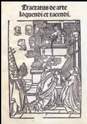
Albertanus von Brescia, Ars Loquendi et tacendi Entstehung: Deventer: Jacobus de Breda, 5./21. Mai 1499 Wiss. Bibliothek der Stadt Trier