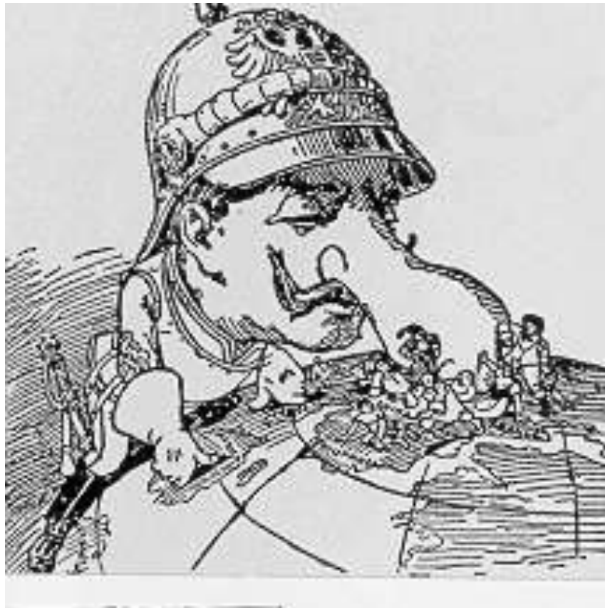
(Aus der New Yorker Zeitschrift „Judge“, 1899)